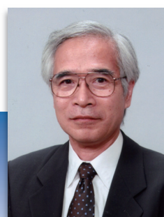
入江 正浩 九州大学名誉教授