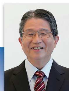
藤嶋 昭 東京理科大学学長