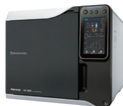
島津ガスクロマトグラフ Nexis GC-2030