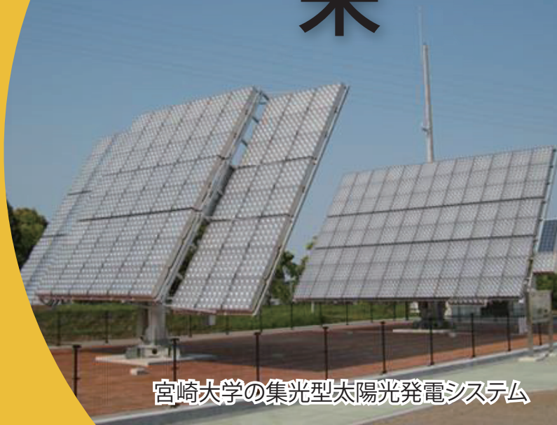
宮崎大学の集光型太陽光発電システム